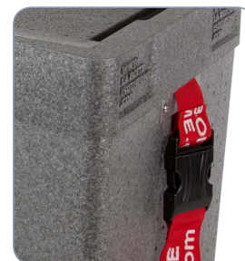
Sangle de transport détachable