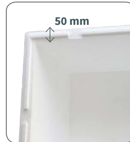
Epaisseur parois 50 mm