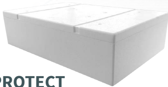
X-PROTECT 1 fond (XPSF) + 1 couvercle (XPSC)