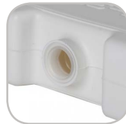
Bouchon soudé par ultrasons